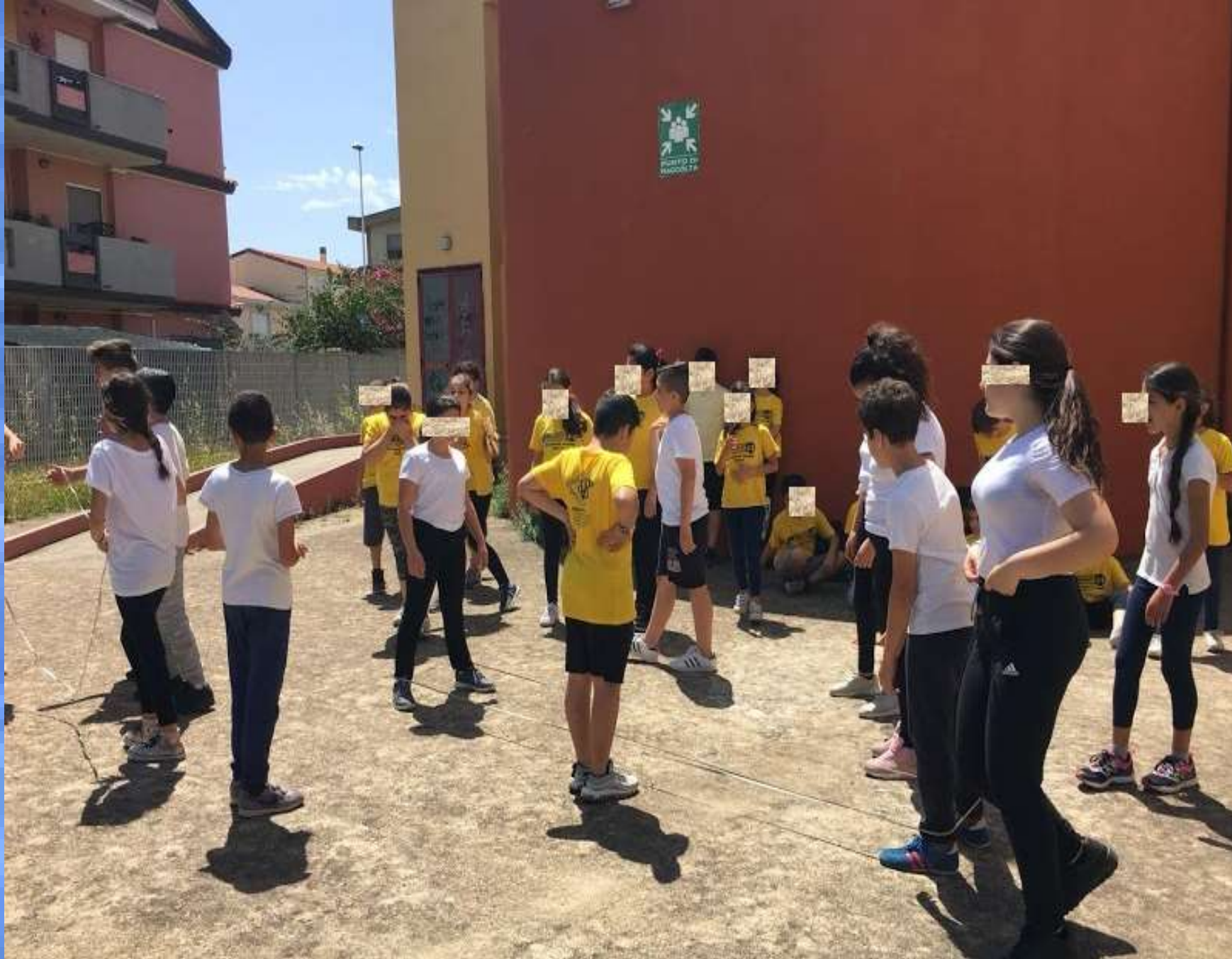
Le classi 5° A e B incontrano gli alunni della scuola secondaria di primo grado in via Perdalonga