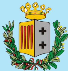
Città Metropolitana di Reggio Calabria