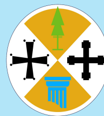
Patrocínio Regione Calabria