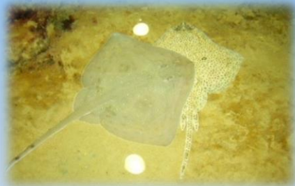
Le simpatiche razze della vasca tattile

Il percorso, completato da un ampio parco giochi si conclude con l'emozionante esperienza della vasca tattile, dove potrete accarezzare razze, stelle marine, uova di squalo e paguri.