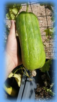
La spugna Luffa