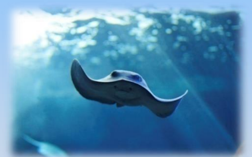
Il Trigone viola nella grande vasca pelagica