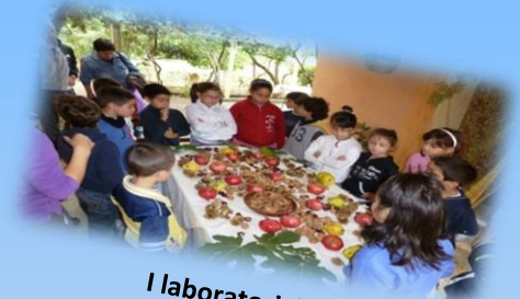
I laboratori didattici