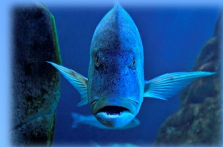
Il dentice, predatore nella grande vasca

Conoscere le principali caratteristiche del nostro mare e la vita dei suoi abitanti è il primo passo per poterlo rispettare.