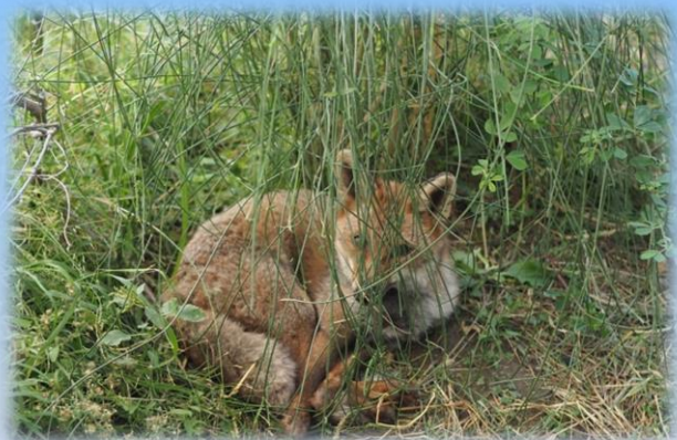
La volpe Rosa Fumetta nella sua nuova casa

A causa delle ferite riportate e dell'imprinting ricevuto durante il periodo di cura la piccola Rosa non può essere reintrodotta nel suo ambiente naturale ed ha iniziato la sua nuova vita!