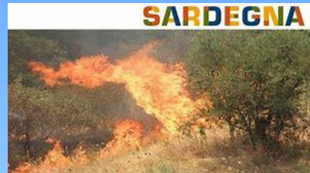
Foto incendio boschivo tratta dal web

La volpe Rosa Fumetta, salvata da un incendio boschivo dal Corpo Forestale dello stato e curata dalla Clinica Veterinaria Due Mari, ha trovato casa all'Acquario di Cala Gonone.