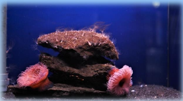
Il pomodoro di mare

Questa visita permette di acquisire nozioni generali sulle 300 specie di organismi ospitati nel nostro Acquario, sul loro habitat e sulle loro principali abitudini di vita imparando insieme ad una esperta guida a conoscere il mare e a proteggerlo.