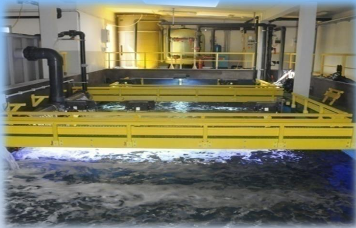
Locali tecnici dell'Acquario di Cala Gonone

Unite la visita tematica al percorso espositivo con la speciale visita ai locali tecnici della struttura... non perdetevi questa esperienza unica!