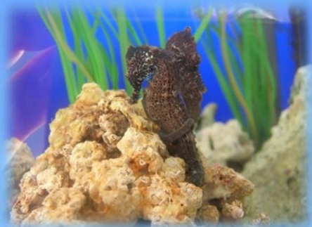
I cavallucci marini

Conoscere le principali caratteristiche del nostro mare e la vita dei suoi abitanti è il primo passo per poterlo rispettare.