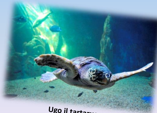
Ugo il tartarugo