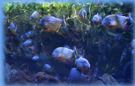
La vasca de Piranha

25 vasche espositive vi aspettano per farvi conoscere le specie tipiche del Mediterraneo, Ugo la tartaruga marina cieca vittima dell'inquinamento dei nostri mari, la volpe Rosa fumetta salvata da un incendio boschivo ad Oristano nel maggio 2017 e molti altri amici come i pesci Piranha e i coloratissimi pesci tropicali.