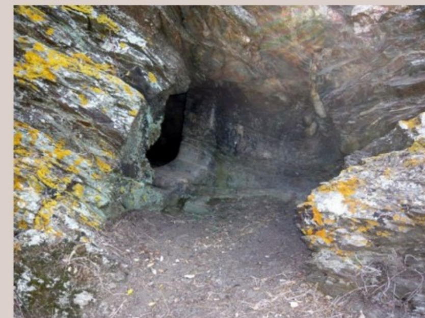
Domus De Janas