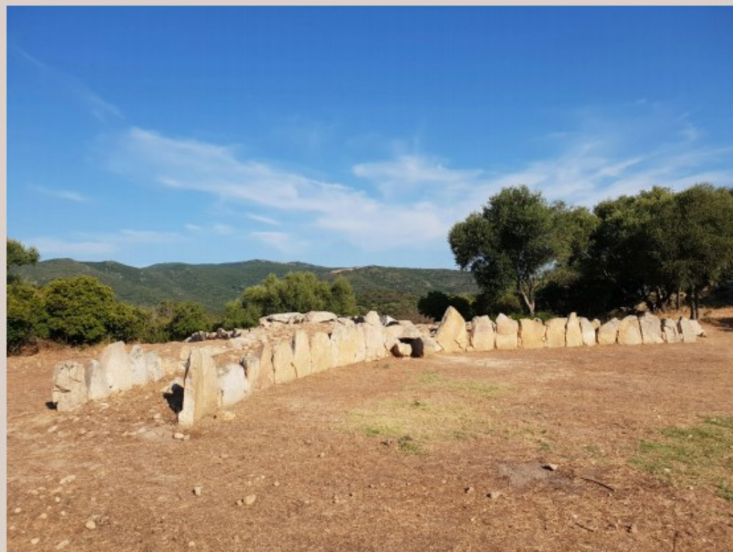
Tombe dei giganti "Su Picante"