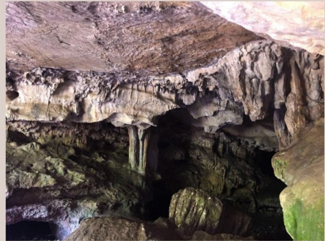
Santa Lucia, Spiaggia di Berchida, Monte Albo, Grotta di Gana e Gortoe