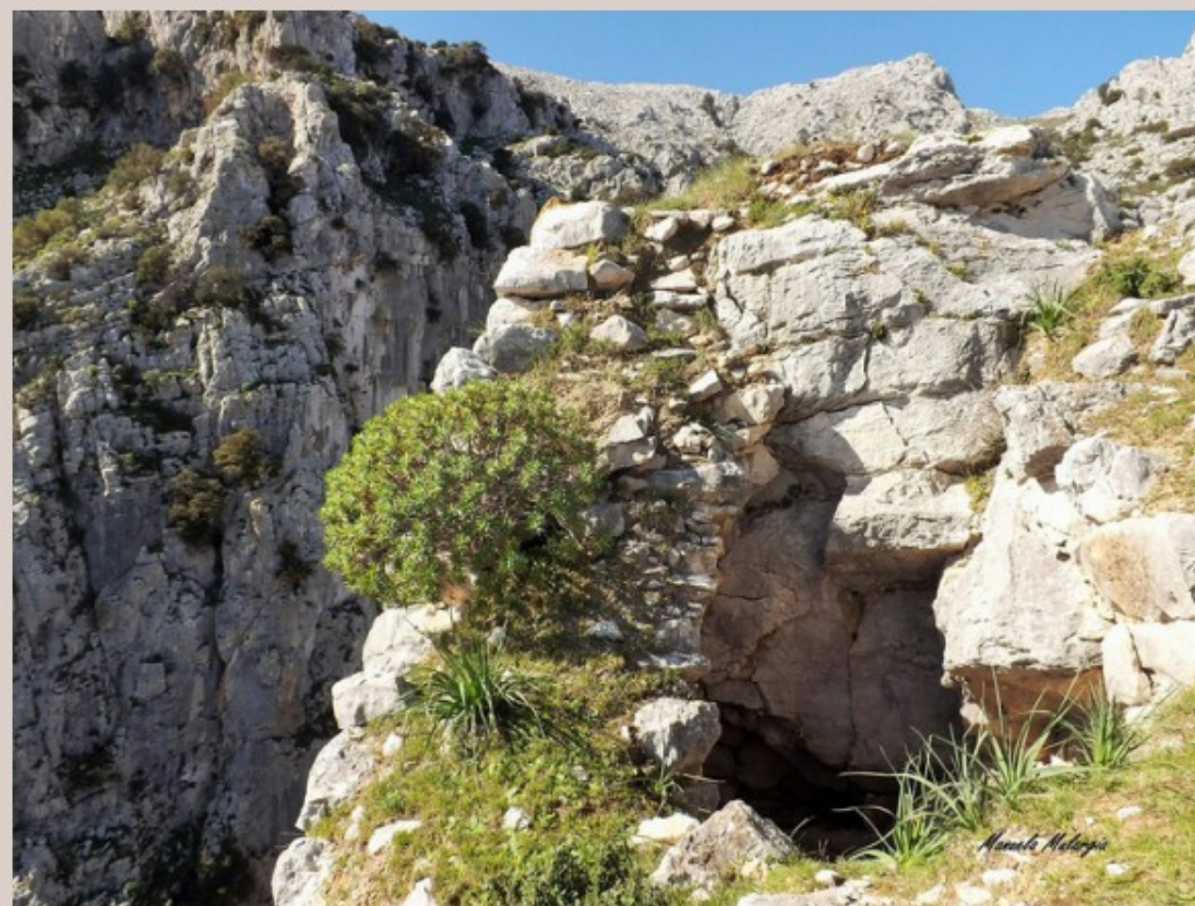
Nuraghe Sas Piperas