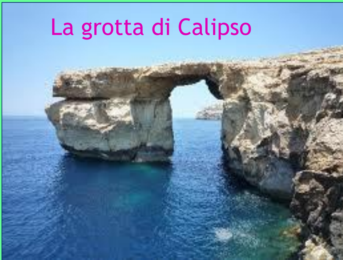
La grotta di Calipso

Il suolo è roccioso, anche se coltivato, grazie al sistema dei terrazzamenti .Il rilievo, costituito da altipiani calcarei, è poco elevato (Ta' Dmejrek, 258 m), ed è caratterizzato da formazioni di origine carsica, come campi carreggiati, caverne e grotte.