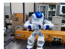
Il robot umanoide della scuola

Possibilità di convitto per i fuori sede