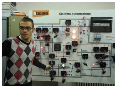
Manutenzione ed Assistenza Tecnica Settore: Apparati ed Impianti Tecnologici Impianti Domotici - Bticino