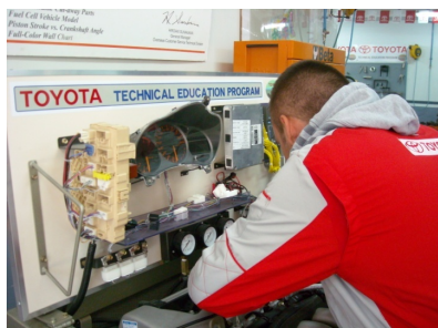
Manutenzione ed Assistenza Tecnica Settore: Meccatronica dell'auto Scuola T-Tep Toyota